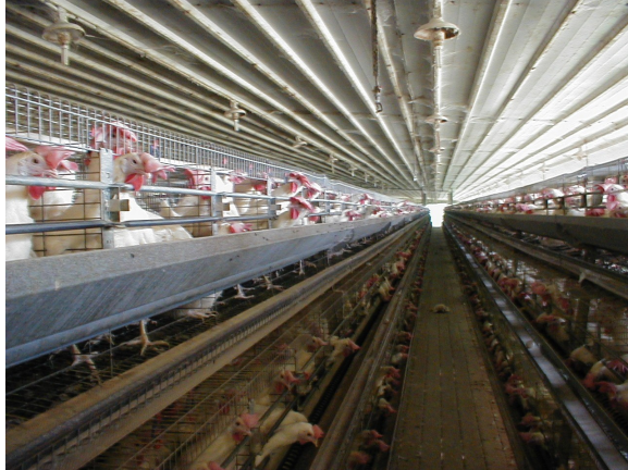
לול סוללה בגבעת חן

מרבית התרנגולות בתעשיית הביצים בישראל מוחזקות בכלובי מתכת חשופים. מספר תרנגולות דחוסות בכל כלוב. במקרה הטוב ביותר השטח המוקצה לכל תרנגולת הוא כשטח דף נייר משרדי (4A). לעתים מוקצה לכל תרנגולת רק כמחצית שטח זה. רצפת הכלוב עשויה רשת ומלוכסנת: