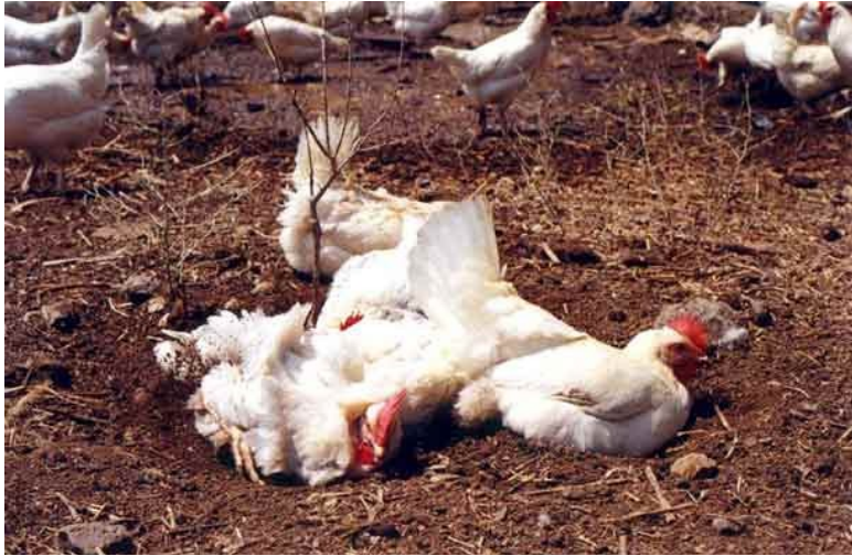
תרנגולות עושות אמבטיית חול בצוותא בלול-חצר במושב היוגב.

הסבל החרף שחוזה התרנגולת בכלוב, והצורך שלה במצע, נובע גם מהדחף לבצע אמבטיות חול. כאשר יש לתרנגולת אפשרות לעשות זאת, היא יוצרת גומה בקרקע, מנפחת את נוצותיה, מתיזה עפר אל תוכן, מנערת אותן ומתגוללת מצד לצד בתוך העפר. אמבטיות החול הללו מאפשרות לתרנגולת לשמור על מבנה הנוצות