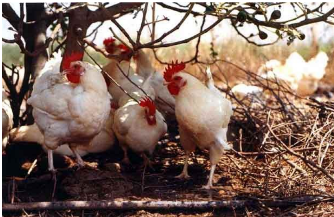
תרנגולות בלול נטול כלובים במושב היוגב.

תרנגולות בתנאי חצר מסוגלות לפעולות שאינן אפשריות בשום אופן גם בכלוב הגדול והמתוחכם ביותר. בכל הכלובים ישנן מגבלות אפילו בנוגע לתנועות כמו מתיחת ראש וצוואר, מתיחת רגליים ופרישת כנפיים. אף כלוב אינו מספק בצורה סבירה את הצרכים לקנן, לנוח על ענף, לעשות אמבטיית חול או לשוטט ולחטט בקרקע. בלולי-חצר, לעומת זאת, התרנגולות יכולה ללכת, לרוץ ולהתעופף. היא בוחרת תיבת קינון, מבטאת את כל מגוון ההתנהגויות הקשורות להטלה ושוהה בקן לצורך ההטלה ללא תחרות מתרנגולות אחרות. יש לה שפע של שטח ומצע כדי לבלות את זמנה בחקירת הסביבה, בשוטטות, בחיטוט ובניקור. היא עושה אמבטיות חול על כל דקדוקיהן בצוותא עם תרנגולות אחרות. יש לרשותה מדפי לינה מוגבהים כדי לנוח עליהם.