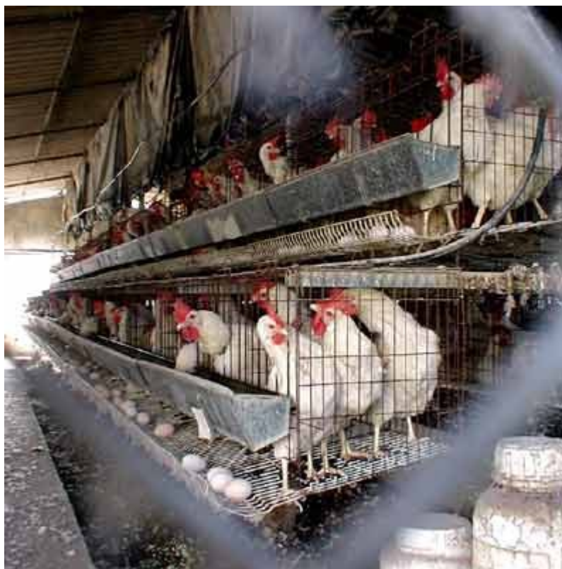
שיטה שאבד עליה הכלח: לול סוללה במושב כפר הנגיד.

התוצאה: מדיניות שבטוח הקצר תיתן סיוע כלכלי ליזמים בעלי-הון, ושבטוח הארוך תוריד כספי ציבור לטמיון, ותשאיר את המשק הישראלי ואת נופי הגליל עם צלקות בלתי-הפיכות, של לולי כלובים ענקיים שהתיישנו ואבד עליהם הכלח.