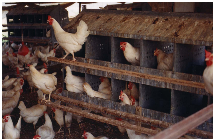
תיבות קינן בלול נטול כלובים במושב היוגב

הצורך בקינן הוא צורך מולד ורב עצמה. התרנגולת זקוקה למסתור מתאים ולחומרי קינן. מחקרים מדעיים מצאו שתרנגולות ישקיעו יותר מאמץ כדי להגיע למקום בו הן יכולות לקנן ממה שהן ישקיעו כדי להשיג מזון לאחר שעות ארוכות של הרעבה 25 . בהעדר אפשרות לקנן, התרנגולת עושה תנועות קינן "על ריק" ותנועות סטריאוטיפיות ומשמיעה קולות מצוקה 26 . כאשר תרנגולת כזו משוחררת למקום שבו יש לה אפשרות להקים קן, היא ממהרת לעשות כן, ומפצה את עצמה על תקופת החסך בשהייה ממושכת בקן – הרבה מעבר לזו של תרנגולות שלא סבלה מחסכים 27 .