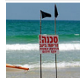
חוף אסור לרחצה בבת-ים